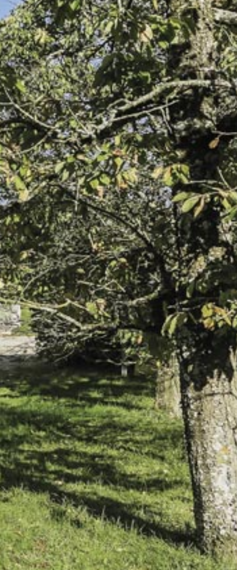
Das neue Blockhaus ist der linke Flügel des Ensembles. Im Bild hinten die alte Scheune des Hofes.