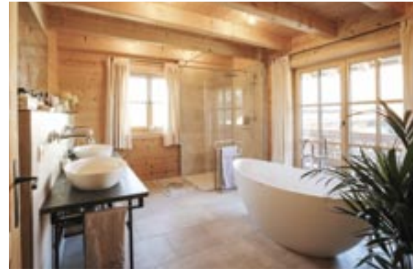
Wellness, hier mal rustikal modern: Das große Familienbad lässt keine Wünsche offen.

Die Kinderzimmer sind mit mehr als 20 Quadratmetern stattlich. Sie ergänzt ein geräumiger Schrankraum, während das etwas kleinere Schlafzimmer mit einer offenen Ankleide auskommt. Ganz oben unterm Dachspitz gibt's noch zwei mit 16 Quadratmetern recht beachtliche Speicherräume. ●●●