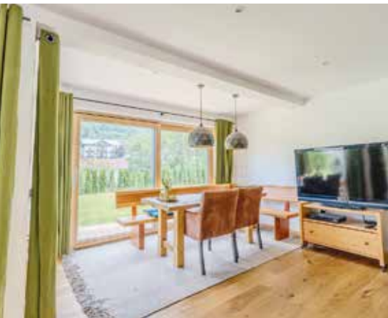
Auch in den Innenräumen dominiert der Baustoff Holz und verleiht ihnen eine heimelige Atmosphäre.